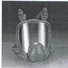
IMAGEN REPRESENTATIVA PARA CLARIFICAR PARTIDA NÚMERO 42.

IMAGEN REPRESENTATIVA PARA CLARIFICAR PARTIDA NÚMERO 36.