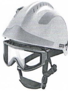
IMAGEN REPRESENTATIVA PARA CLARIFICAR PARTIDA NÚMERO 36.

IMAGEN REPRESENTATIVA PARA CLARIFICAR PARTIDA NÚMERO 34.